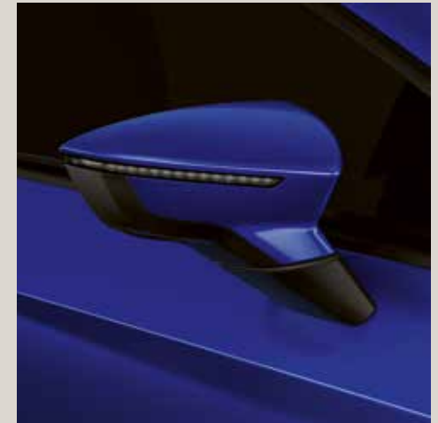
Mystery Blue 2 St FR