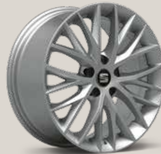
Dynamic 30/3 St