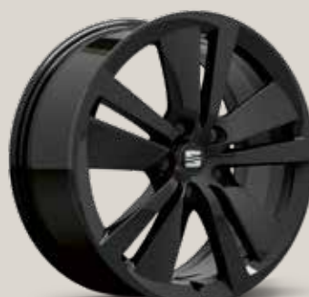
Black R St FR