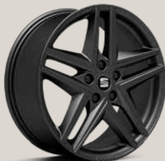
Svart Sportfälg (RDH) FR