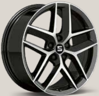
Performance 30/2 Machined FR