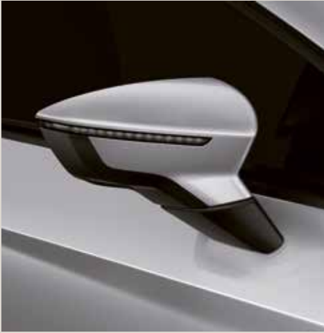
Urban Silver 2 St FR