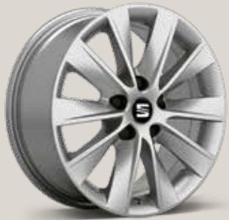
Design 30/2 St