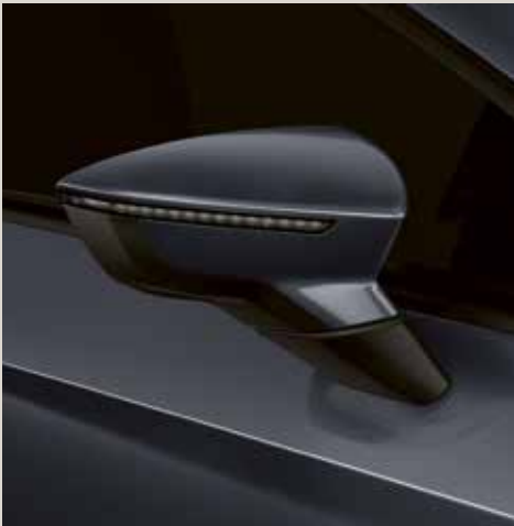
Magnetic Tech 2 St FR