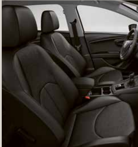
Svarta sportstolar i Alcantara® CE + WL3