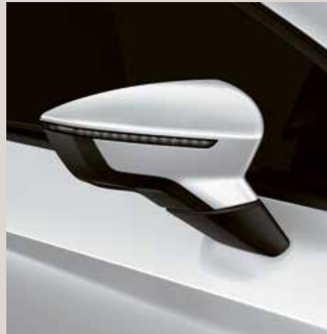
Nevada White 2 St FR