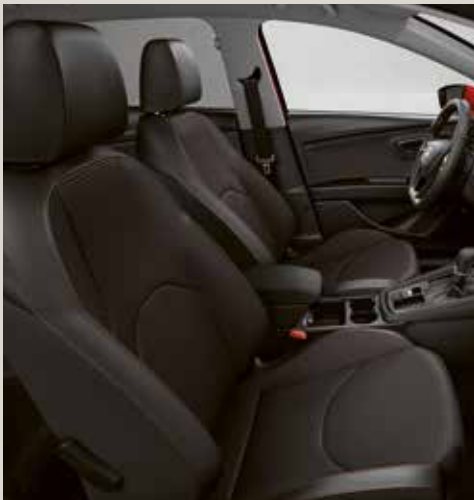
Tygklädsel Techny svart GE