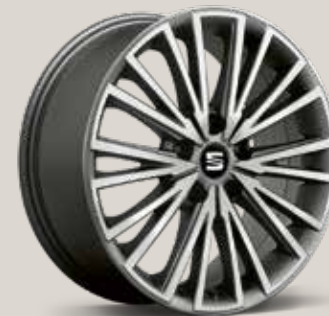
Dynamic 30/4 Atom Grey St