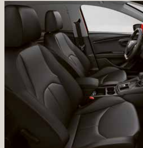
Svarta sportstolar i läder GE+WL1