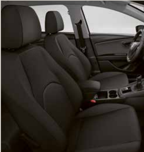
Tygklädsel Tresil CE