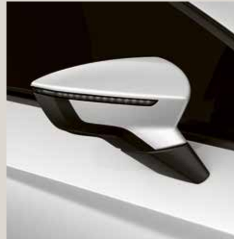
Candy White 1 St FR