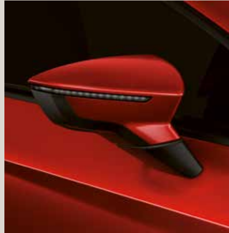
Desire Red 2 St FR