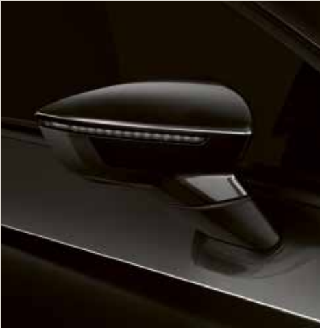
Midnight Black 2 St FR