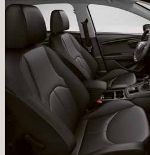
Svarta sportstolar i läder CE+WL1