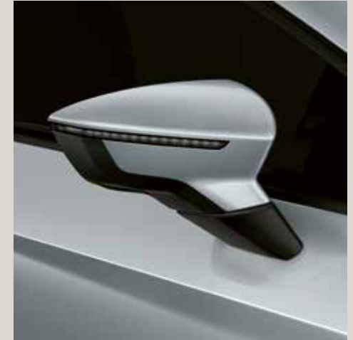
Dynamic Grey 2 FR