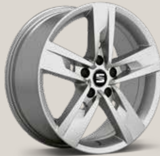
Dynamic 30/2 FR