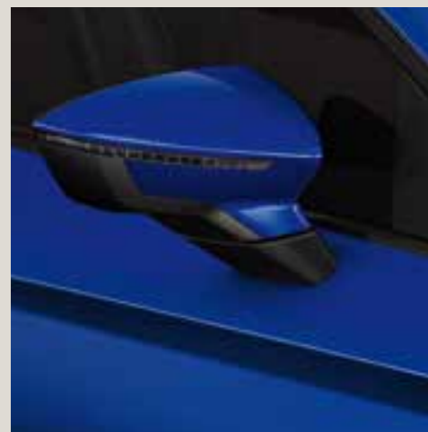
Mystery Blue metallic St FR