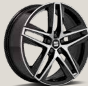
Performance FR (Ej TGI CNG)