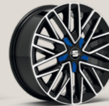
Diamond cut i Mystery Blue St FR