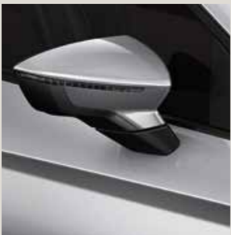
Urban Silver metallic St FR