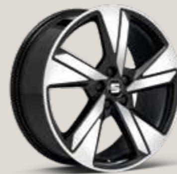
Diamond cut i Piano Black FR