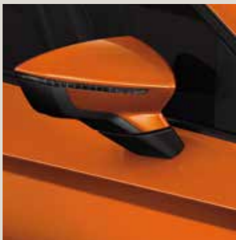
Eclipse Orange metallic St FR