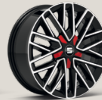
Diamond cut i Desire Red St FR