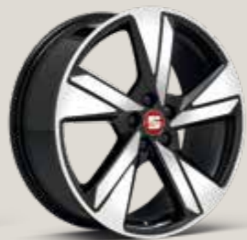
Diamond cut i Desire Red FR