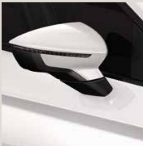
Candy White solid St FR