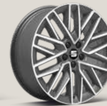
Diamond cut i Cosmo Grey St FR