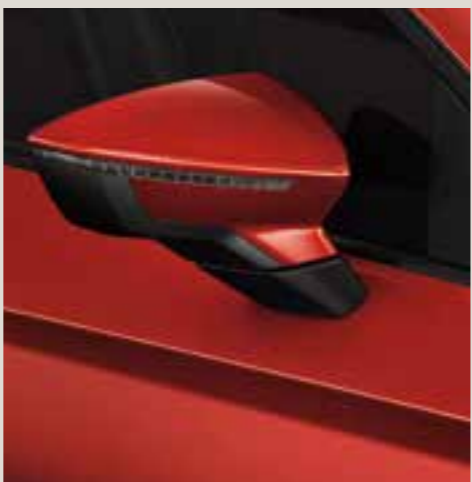
Pure Red Solid St FR