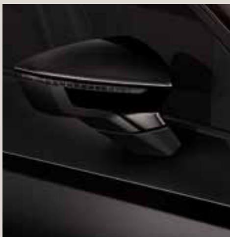
Midnight Black metallic St FR