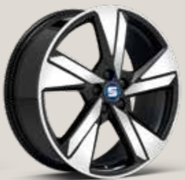
Diamond cut i Mystery Blue FR