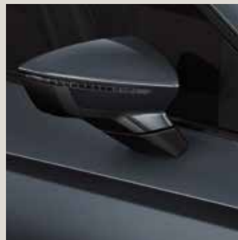
Magnetic Tech metallic St FR