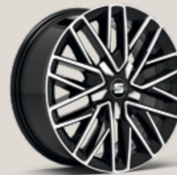
Diamond cut i Silver St FR