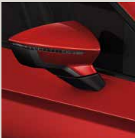
Desire Red metallic St FR