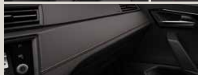
Dinamica® klädsel i mikrofiber, svart med kontrastsöm FL + PL7 FR