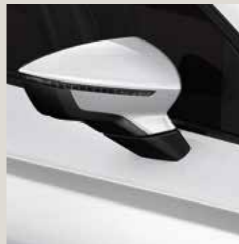
Nevada White metallic St FR