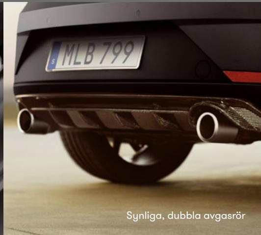
Synliga, dubbla avgasrör