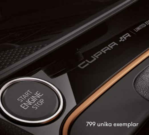
799 unika exemplar