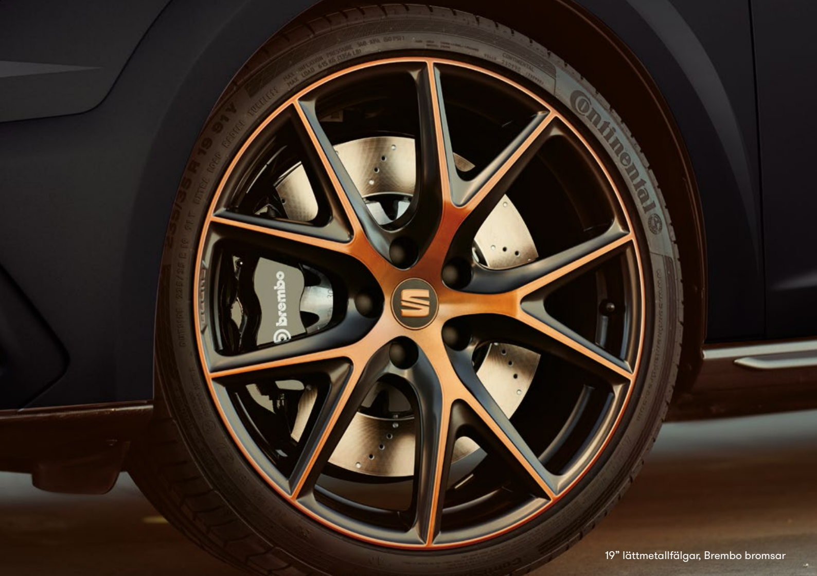
19" lättmetallfölgar, Brembo bromsar