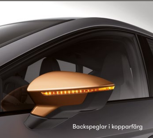
Backspeglar i kopparfärg