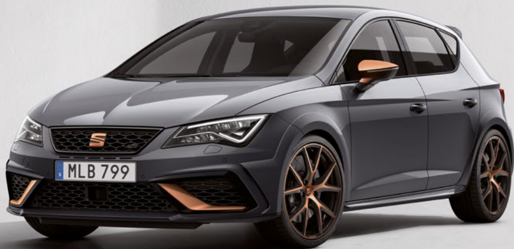
Pirineos Grey Metallic