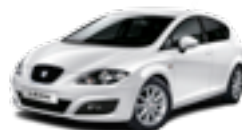
SEAT LEON Bensin, diesel, miljöbil