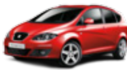
SEAT ALTEA XL Bensin, diesel, miljöbil