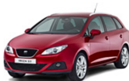
SEAT IBIZA ST

Alla bilar behöver service. Med serviceavtal undviker du obehagliga överraskningar eftersom du betalar en fast månadskostnad och vet exakt vad din service kommer att kosta. Serviceavtal finns i två nivåer med olika omfattning och innehåll. Du kan välja Serviceavtal eller Service- och Reparationsavtal. Reparationsarbete och delar utförs alltid med SEAT Originaldelar på auktoriserad SEAT-verkstad. En välfylld servicebok betyder ett tryggare ägarbyte. Med vår finansiering får du dessutom serviceavtal (vid leasing) på samma faktura som finansieringen. Näringsidkare får lyfta 100% moms på servicekostnaden. För vissa SEAT-modeller ingår serviceavtal upp till 6.000 mil eller 24 månader (vilket som inträffar först) och förutsatt att service sker på en auktoriserad SEAT-verkstad.