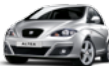
SEAT ALTEA Bensin, diesel, miljöbil