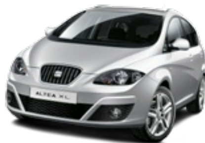
SEAT ALTEA XL

En vagnpark genererar fasta, rörliga och indirekta kostnader som leasingavgift, skatt, försäkring, drivmedel, tvätt, parkering, självrisk, verkstadsbesök, sociala avgifter med mera. Med andra ord ett pappersflöde med många fakturor och administration som kostar pengar. Svårt att kontrollera och svårt att budgetera. Milfakta samlar in samtliga bilrelaterade kostnader (inklusive personalbil) på en faktura som färdigkonteras enligt ditt företags kontoplan. Statistik per bilmodell eller för hela vagnparken hittar du sedan enkelt med vår webblösning.