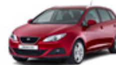
SEAT IBIZA ST Bensin, diesel, miljöbil