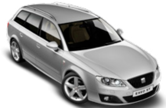
SEAT EXEO ST

Vi erbjuder individuellt anpassad finansiering för stora och små företag. Du kan med fördel kombinera vår finansiering med försäkring och serviceavtal. Allt på samma faktura specificerat var för sig. Leasing är generellt det enklaste och mest ekonomiska sättet att finansiera företagets bilar. Dels för att momsen på leasingavgiften oftast är till hälften avdragsgill (personbilar), dels för att leasing är en finansieringsform som löser företagets bilbehov utan att binda kapital. Med leasing kan du dessutom lämna eventuellt kreditutrymme hos din bank outnyttjat, och istället använda det då det verkligen behövs. Leasing är en flexibel finansieringsform, som ofta kombineras med serviceavtal och där momsavlyft på leasingavgiften och servicekostnaden ger ekonomiska fördelar.