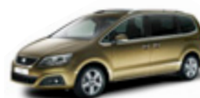
SEAT ALHAMBRA Bensin, diesel

SEAT Finansiering, 151 88 Södertälje Tel: 08-553 869 65 marknad@vwfs.se