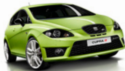
SEAT LEON CUPRA R

De sker bara på olika sätt. En del väljer banklån eller belånar bostaden för att kunna betala bilen "kontant". Andra har tillgångar eller sparande som realiserar. Finansieringen av din SEAT är en viktig del av bilköpet och våra finansieringsformer är en del av erbjudandet från SEAT. Vi finns hos SEAT-handlaren där säljaren är vårt ombud och samarbetspartner.