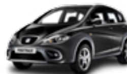
SEAT ALTEA FREETRACK 4WD Bensin, diesel