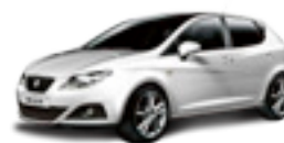
SEAT IBIZA Bensin, diesel, miljöbil